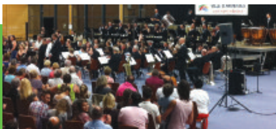
Concert de l'OHDI du 4 Juillet 2014